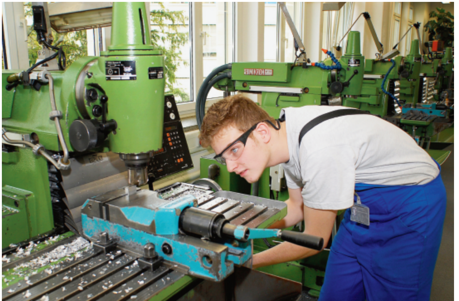
Dans le secteur de la mécanique, il reste souvent des places d'apprentissage, soit parce que les jeunes ne s'y intéressent pas, soit parce que les candidats n'ont pas le niveau de connaissances requis.

Il y a donc inadéquation entre l'offre de places disponibles et la